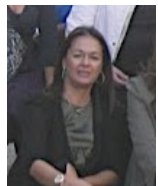
Λύκειο των Ελληνίδων.